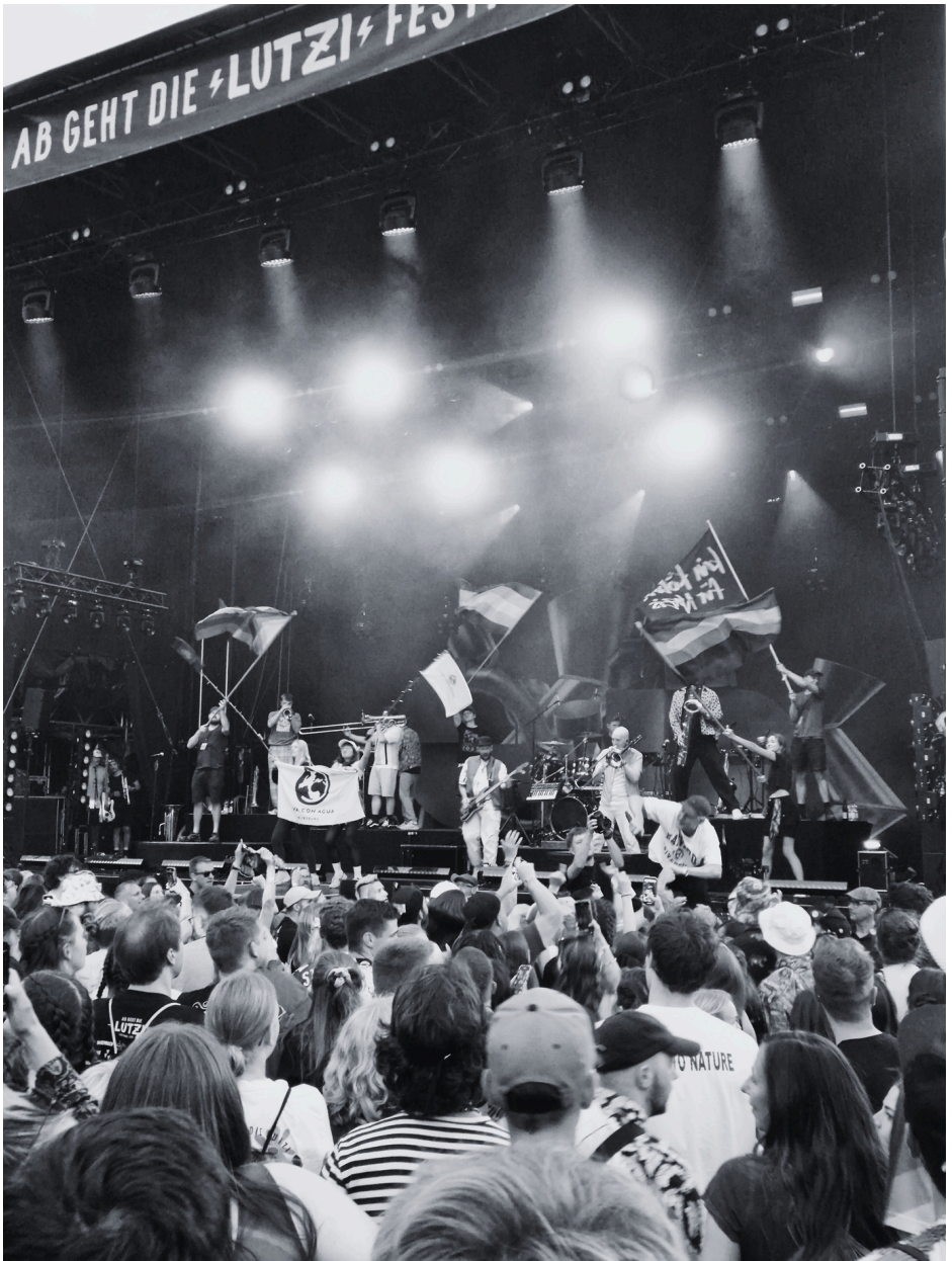
(Rottershausen, Ab geht die Lutzifestival)